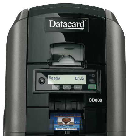
Принтер для карт Datacard® CD800™