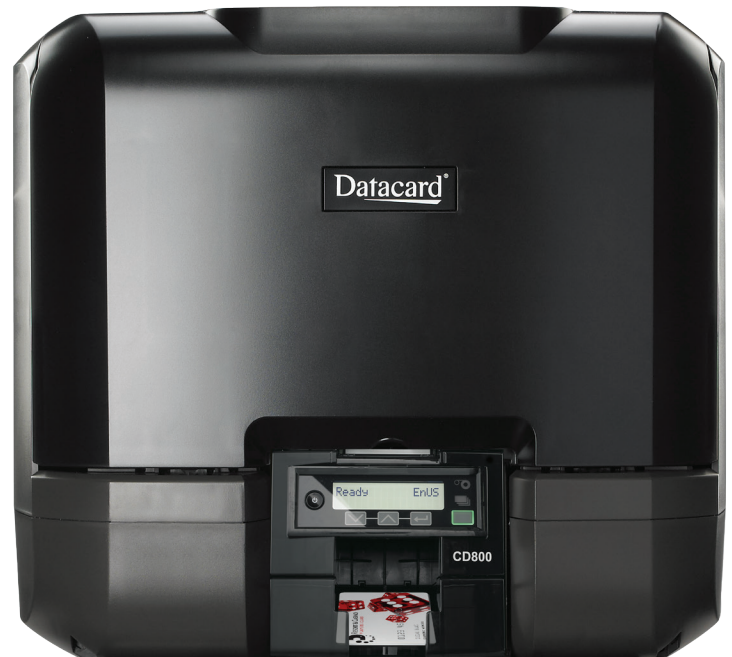
Принтер для карт Datacard® CD800™ с 6 лотками